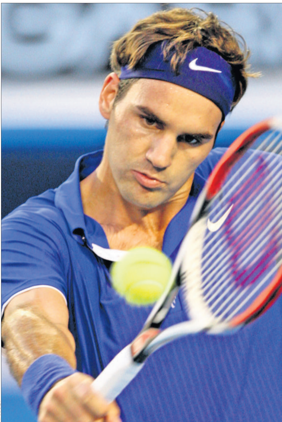
AMBITION En collaborant avec Darren Cahill, Roger Federer a la ferme intention de reconquérir son statut de N° 1 mondial. MELBOURNE, LE 1 er FÉVRIER 2009