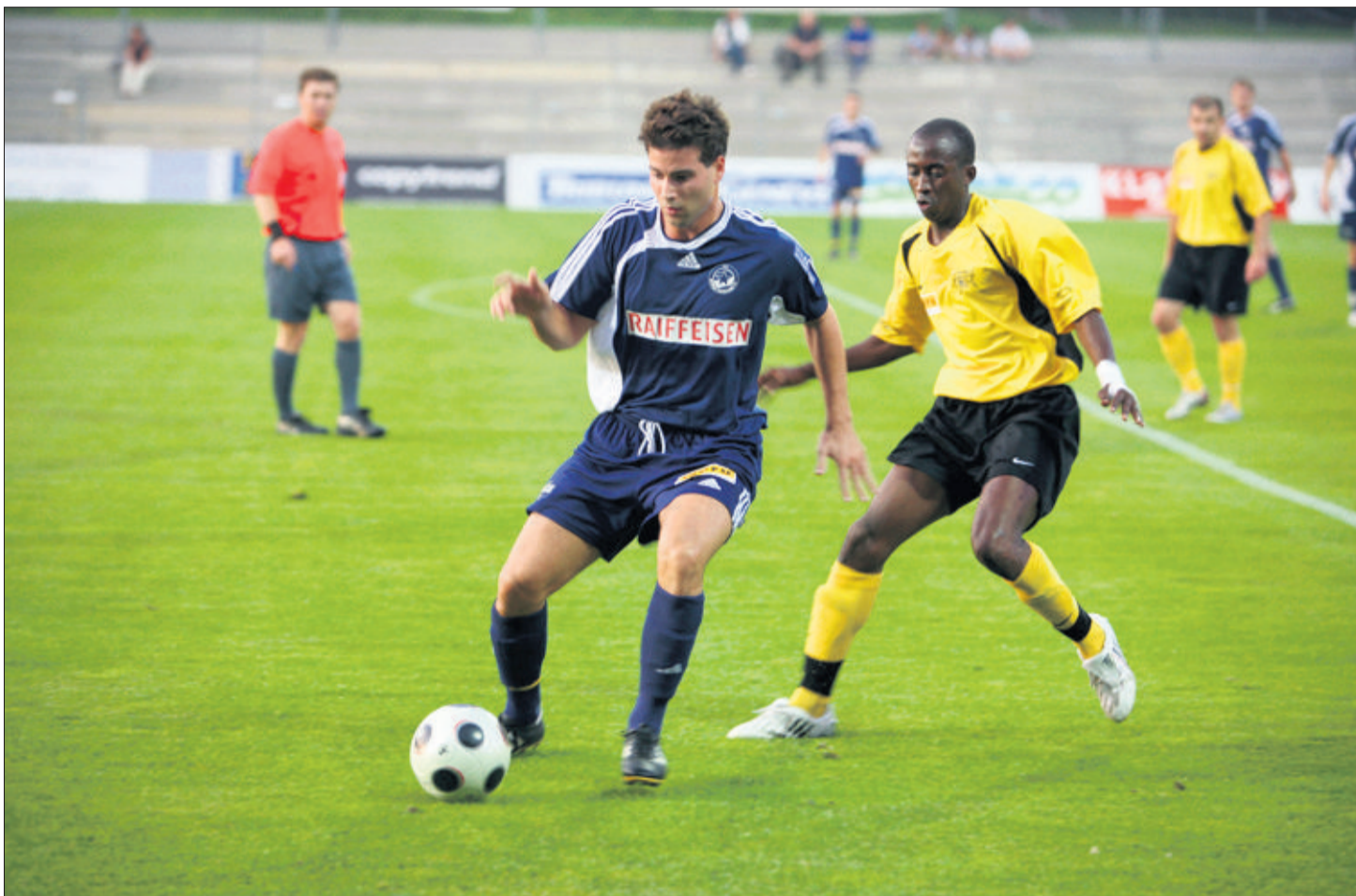
Derbys genevois. Le premier de cette année opposera Carouge et Meyrin, le 14 mars au stade des Arbères.

Bilan positif pour la préparation. «Nous avons pu nous entraîner sur le terrain synthétique et disputer des matches de préparation contre Thoune, Servette et le Stade Nyonnais, trois équipes de Challenge League. J'en retiens une bonne impression et je relève un bon état d'esprit. J'ai assisté à quelques matches du premier tour. Je pense que les Chênois n'y ont pas assez exprimé leurs qualités. Je vais prôner un football plus offensif. Bref, nous voulons séduire pour parvenir... à nous en sortir», conclut Barriquand. (jac)