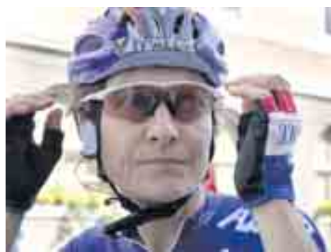
Jeannie Longo ha detto sì a Brissago.