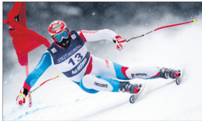
Didier Cuche. Déjà impressionnant hier à l'entraînement.