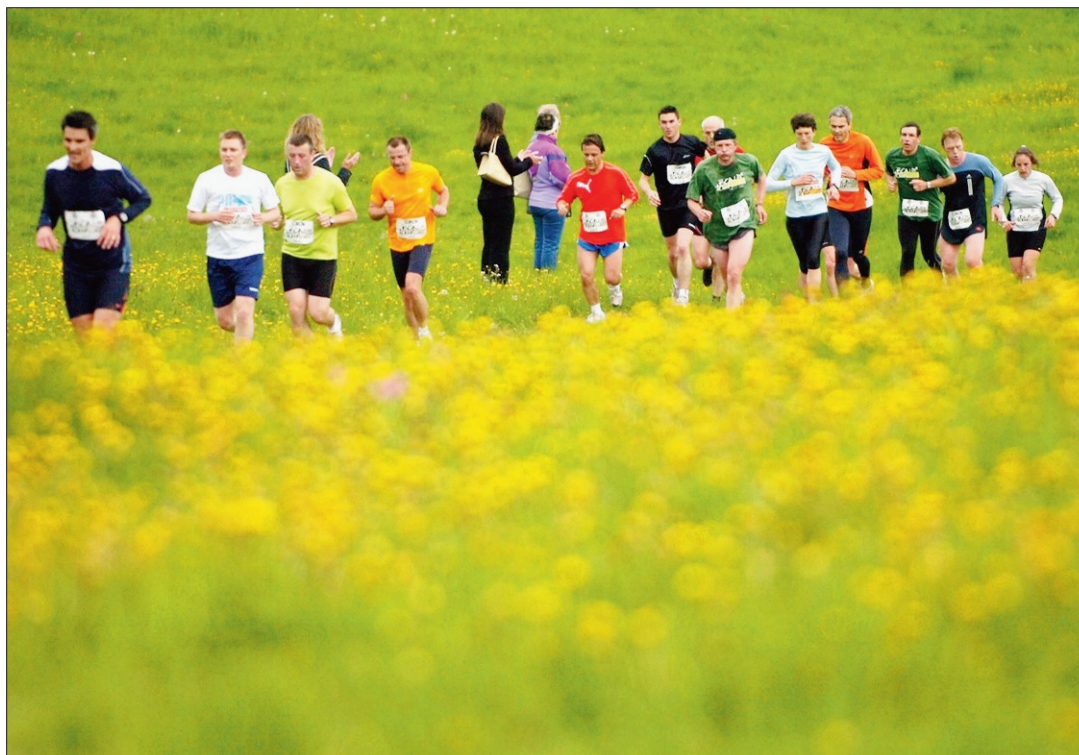
BONNES HABITUDES Les organisateurs du Tour du canton veillent toujours à proposer des parcours accessibles et dépourvus d'asphalte au peloton.