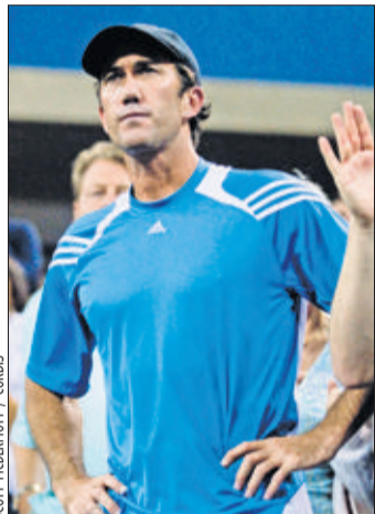
Darren Cahill a été l'entraîneur de Hewitt et d'Agassi.

Sans véritable coach depuis sa rupture avec Tony Roche en mai 2007, Roger Federer a décidé de faire confiance à ce technicien hors pair qui lui permettra, peut-être, de trouver les clés pour battre Rafael Nadal.