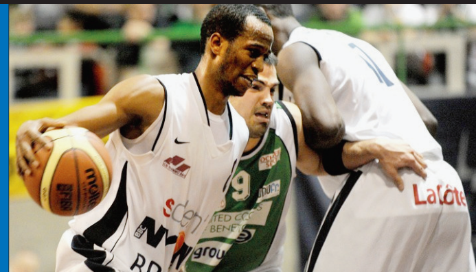
Archives Alexis Voelin