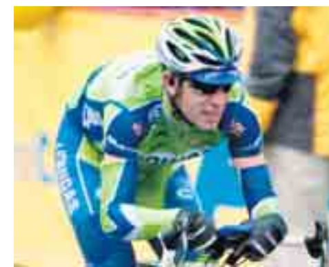
Aspettando l'esplosione di Vincenzo Nibali...

Il ciclismo italiano, umiliato sabato a Como, ha concluso la sua stagione 2009 senza soddisfazioni nei grandi appuntamenti. Un'annata nera, assolutamente lontana dal grande passato degli azzurri della bicicletta. Assenti dal podio del "Lombardia" per la prima volta da undici anni a questa parte, i rappresentanti del paese re del ciclismo mondiale hanno subito quindi una delle peggiori sconfitte in casa della loro storia. Un finale... normale, se vogliamo, dopo i Mondiali e i grandi giri.