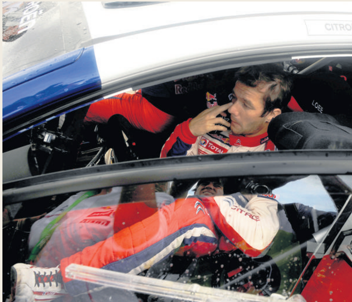
Sébastien Loeb n'échangera pas le baquet de sa Citroën CX contre celui d'une formule 1.

Sébastien Loeb, le quintuple champion du monde des rallyes, n'a pas obtenu la «super-licence» qui lui aurait permis de participer éventuellement au GP d'Abu Dhabi de formule 1, le 1er novembre. «Sébastien avait fait la demande et il a eu la réponse aujourd'hui. Il n'est pas si déçu que cela,