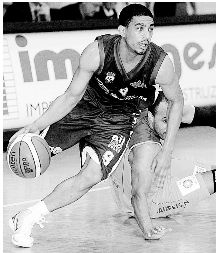
AVANTI TUTTA Hamilton e la SAM affronteranno questa sera Swiss Central per l'accesso agli ottavi di Coppa Svizzera.