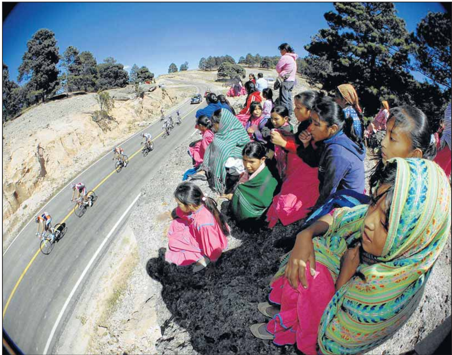
Au Mexique, on roule toujours, à témoin cette image de la 3 e étape du Tour de Chihuahua.