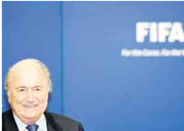
Joseph "Sepp" Blatter sogna un quarto mandato come presidente FIFA.

Sepp Blatter è sicuro di non voler lasciare il calcio. Troppo presto. In fondo ha "solo" 73 anni... Il vallesano ha infatti dichiarato di voler ottenere un quarto mandato come presidente della FIFA, carica che lui ricopre ormai dal 1998. «La mia missione nel calcio non è ancora terminata, ho ancora bisogno di tempo», ha spiegato Blatter alla "Gazzetta dello Sport", aggiungendo che spera che il congresso della federazione internazionale gli rinnovi la fiducia a Zurigo nel 2011. «Il calcio è la mia vita». In caso contrario, Blatter non si deprimerebbe e, anzi, ha già un piano di riserva. «Sì, tornerei al mio paesino, a Visp, e parteciperei ai tornei di bocce. C'è un bel bocciodromo al coperto. Ma io amo i grandi stadi». E allora sospettiamo che farà di tutto per continuare a viverne l'atmosfera dall'alto, dalla carica più importante dell'intero movimento mondiale. A proposito di Mondiale, alla "rosea" ha poi svelato: «Sarà un Mondiale meraviglioso. Ci sono tutte le migliori nazionali: se qualcuna