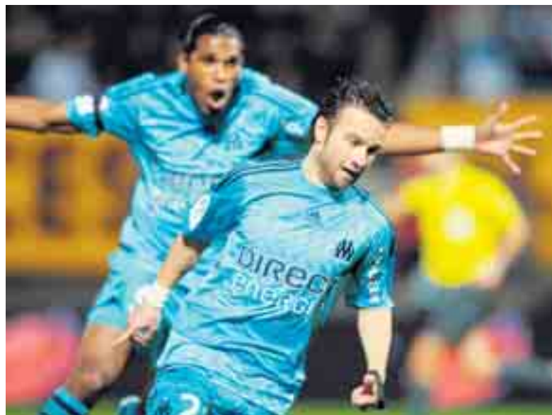
Attenzione al Marsiglia, anche se è ancora a quota zero punti.

Zurigo - Marsiglia oggi 20.45 ZURIGO: Leoni; Koch, Barmettler, Tihinen, Rochat; Gajic, Segrtter, Tico; Margairaz; Vonlanthen, Alphonse.