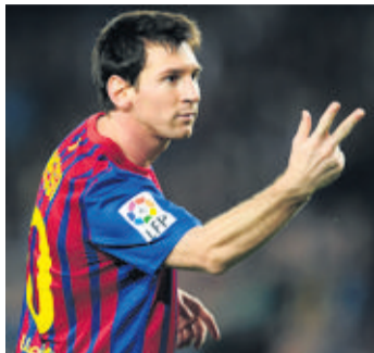
Le génial Messi a marqué trois fois. Mais Real reste devant.

Le lutin barcelonais a marqué trois buts, mais c'est Madrid qui pointe en tête