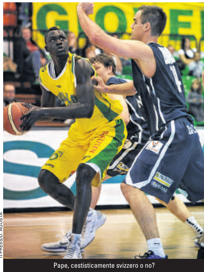
Pape, cestisticamente svizzero o no?

Della partita giocata, diremo che si è visto uno strepitoso Uzas nei primi 20 minuti: sei triple consecutive, un paio di numeri da extraterrestre, un'ottima difesa e 27 punti sul tabellino. Per il resto una gara che il Vacallo ha condotto sin