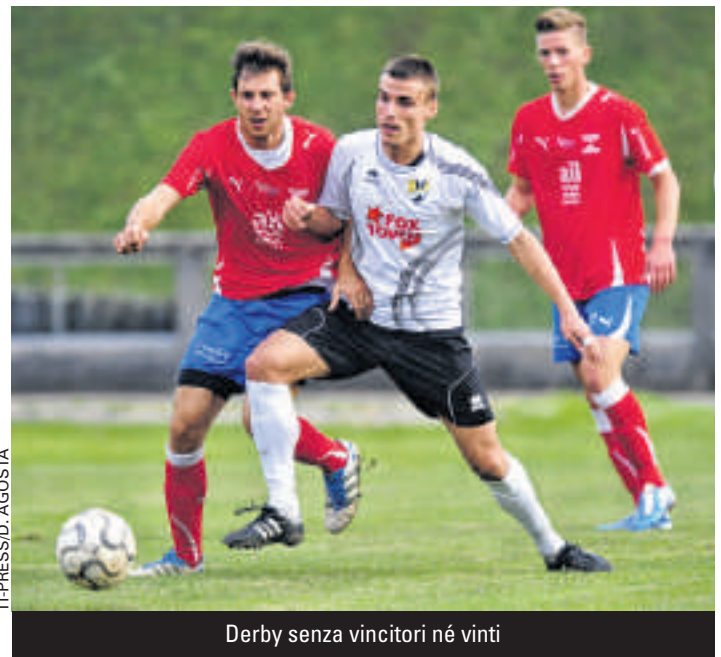
Derby senza vincitori né vinti