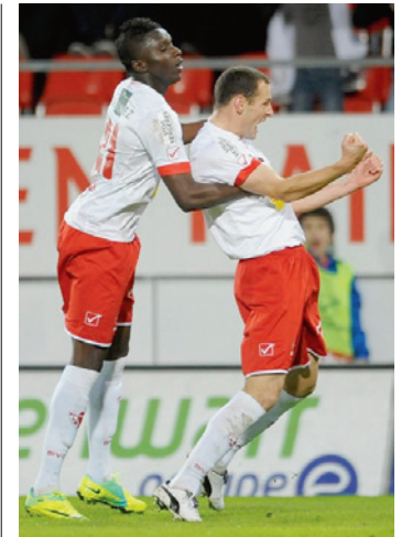
Le FC Sion a battu Thoune (2-0) samedi à Tourbillon.