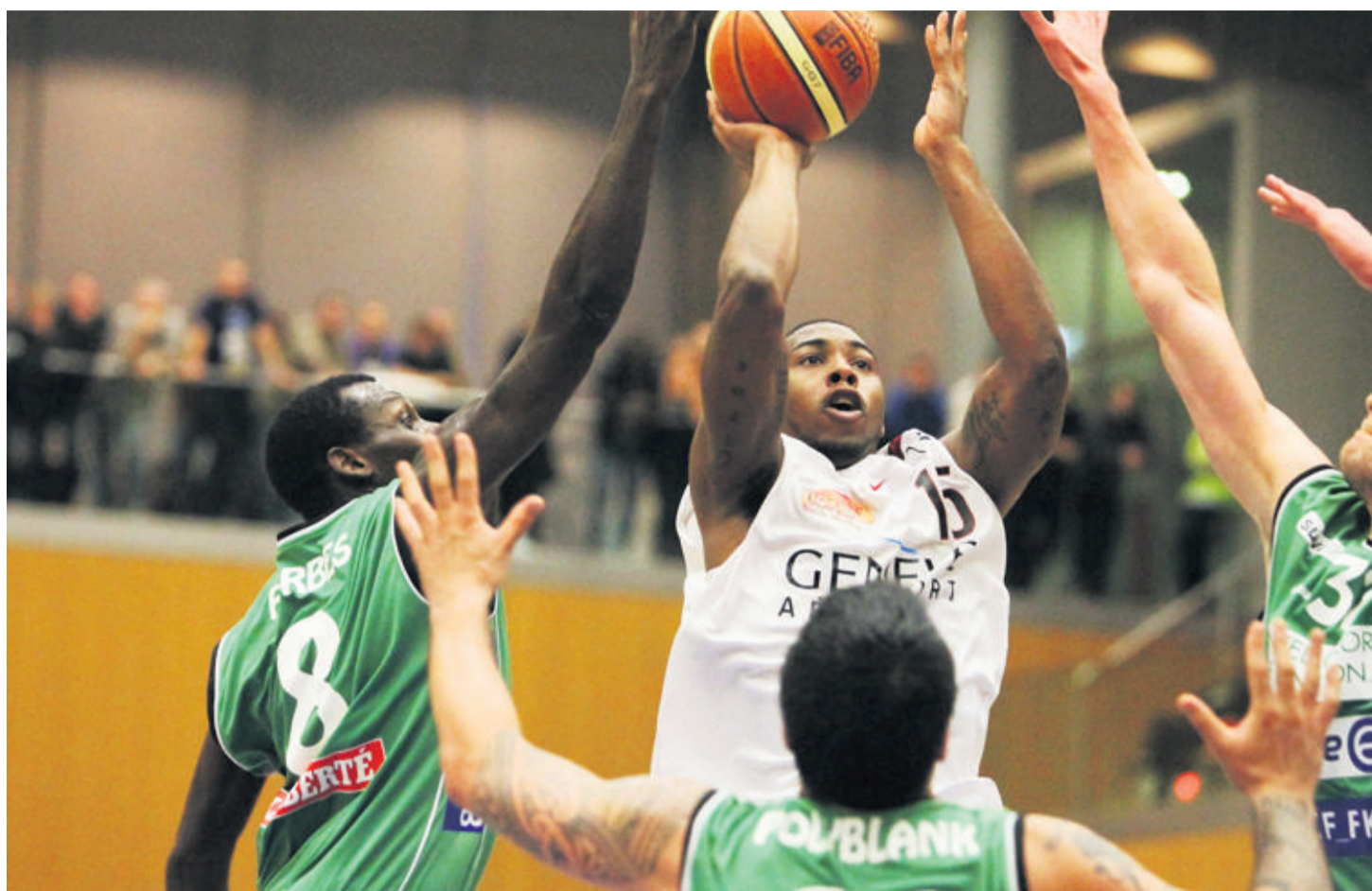
Barnette déborde Forbes et Polyblank. C'était avant que les Lions de Genève n'oublient leurs bonnes intentions. Dommage. GEORGES CABRERA