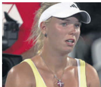
Caroline Wozniacki a quitté le court en larmes.

Cette blessure intervient à cinq jours de l'Open d'Australie et fait douter de sa participation à la première levée du Grand Chelem de l'année. Sa défaite signifie également que Petra Kvitová pourrait lui ravir sa place au sommet de la