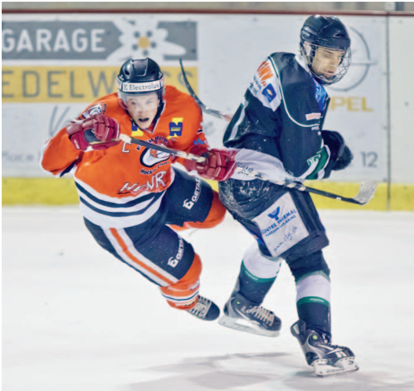
Les Bulldogs ont d'abord trébuché avant de passer l'épaule lors de l'ultime période. Une victoire précieuse dans la course aux play-offs. CHAMPI