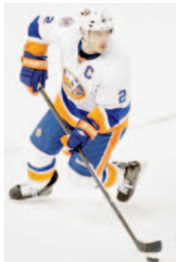
Mark Streit a délivré trois assists mardi soir face à Detroit.

Les matches de mardi soir ont eu une saveur particulière pour les Suisses de NHL, trois d'entre eux ayant en effet inscrit des points. La palme à Mark Streit, dont les New York Islanders ont fêté une victoire de prestige en infligeant un sec 5-1 aux Detroit Red Wings. Le Bernois s'est fait l'auteur de trois assists. Les Isles, parmi lesquels Nino Niederreiter a également joué, ont fait la différence dans la deuxième période avec trois buts. Streit a été le joueur le plus utilisé avec 18'22 de glace. Le Bernois compte 22 points cette saison (2 buts et 20 assists). Les Anaheim Ducks, sans