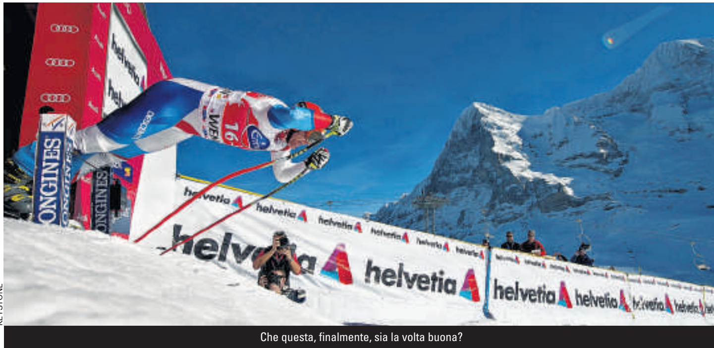
Che questa, finalmente, sia la volta buona?

Che Didier Cuche si sia ampiamente meritato un successo al Lauberhorn, ai suoi avversari importa davvero poco. Raramente nelle scorse stagioni la prova è stata aperta come quest'anno. Il pettorale rosso di leader della classifica lo indossa Miller, il quale precede però la