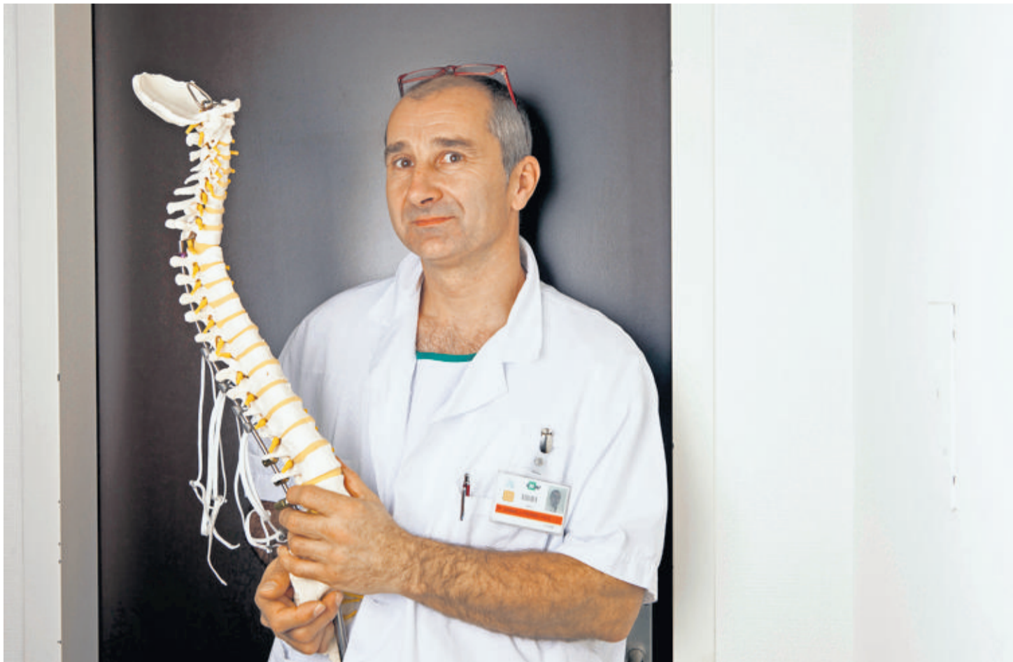
Pour Pierre-Yves Zambelli, certaines pratiques sportives exposent leurs pratiquants à des soucis futurs. FRANCESCA PALAZZI