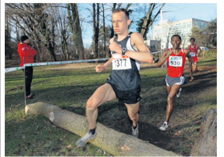
Le Cross de Vidy a été rebaptisé. Mais la passion de ceux qui organisent l'épreuve reste la même. CHRIS BLASER

Inscriptions. Jusqu'à une heure avant le départ, selon la catégorie. Renseignements sur: www.footing-club.ch. Sur place, cantine chauffée