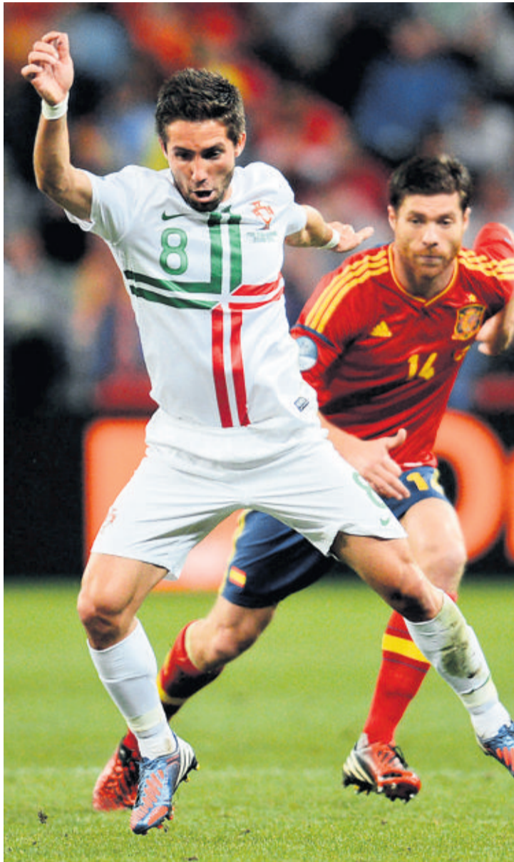
Joao Moutinho, Robin van Persie et Luka Modric: trois joueurs prêts à changer de tricot.

Meilleur buteur de Premier League, le Néerlandais Robin van Persie coûte apparemment moins cher (environ 25 millions d'euros). A la chasse à l'attaquant qui fera son bonheur, la Juventus compte bien en profiter. La «Vieille Dame» s'est fait rembarquer une première fois par Arsenal, mais elle s'apprête à formuler une deuxième offre. Il se murmure que les champions d'Italie pourraient, en cas d'échec, finir par se tourner vers