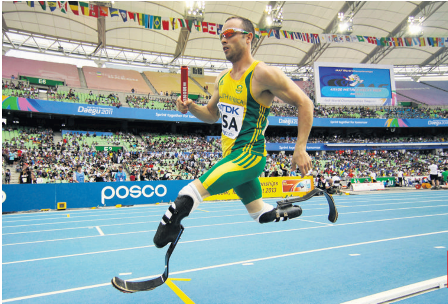
En 2008, le TAS avait invité l'athlétisme à voir l'intégration de Pistorius «comme l'un des défis de la vie au XXIe siècle».

Mais d'autres ont démontré que non. Et Pistorius, rodé à ces interrogations, y répond point par point sur son site internet. Non, ses prothèses fabriquées spécialement pour les athlètes amputés ne dégagent pas une puissance positive à chaque rebond, ni n'absorbent la puissance négative. Elles sont «des ressorts élastiques passifs». Non, elles ne lui permettent pas de faire des foulées plus longues, ni de se fatiguer moins, ou