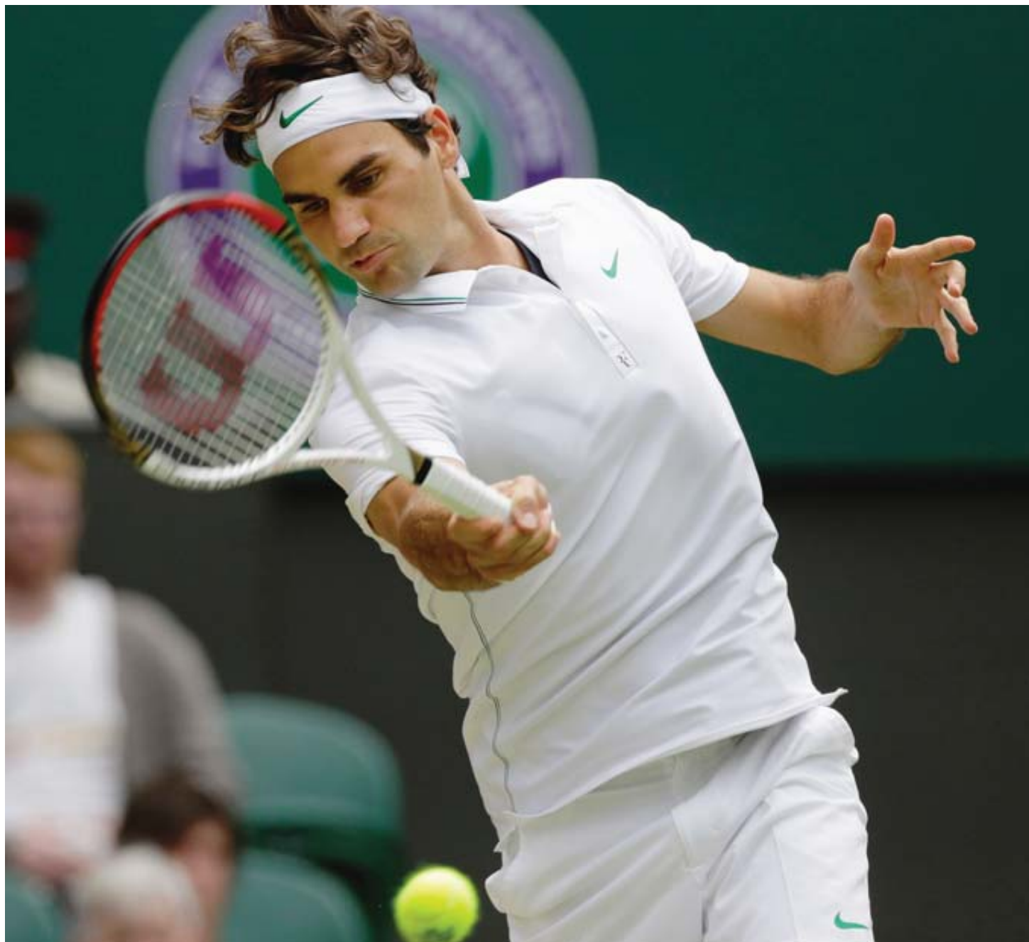
Roger Federer a atteint sa 32e demi-finale d'un tournoi du Grand Chelem. Record de Jimmy Connors battu.

Pour Federer, Youzhny, 30 ans et papa comme lui, est tout excusé. «Mikhail est un type génial. C'est un grand combattant, qui explose parfois et qui cherche le soutien du public. Ça ne me gêne pas. Et même quand ça va mal, il le prend toujours du bon côté.» Le No 3 mondial est d'autant plus compréhensif que le Russe est l'une de ses victimes préférées. Ne l'a-t-il pas battu quatorze fois en autant de confrontations? «Avant même le début du