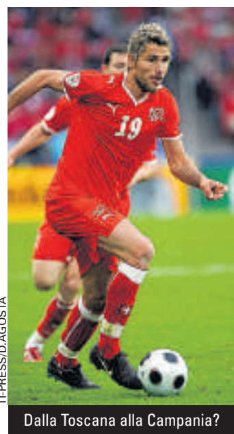
Dalla Toscana alla Campania?

Intanto, secondo quanto dichiarato da Radio Blu, il giocatore continua ad allenarsi da solo al centro sportivo, seguendo la tabella fornitagli da Tami in vista delle Olimpiadi. Un segnale che il centrocampista spera ancora nella possibilità di partire per Londra.