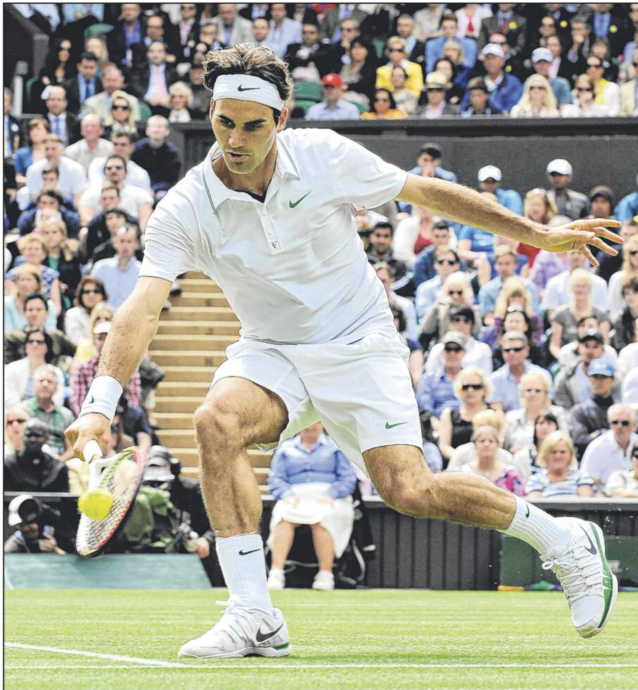
Roger Federer a littéralement déroulé, hier, face à Mikhail Youzhny.

Pour Federer, Youzhny, 30 ans et papa comme lui, est tout excusé. «Mikhail est un type génial. C'est un grand combattant, qui explose parfois et qui cherche le soutien du public. Ça ne me gêne pas. Et même quand ça va mal, il le prend toujours du bon côté.» Le N° 3 mondial est d'autant plus compréhensif que le Russe est l'une de ses victimes préférées. Ne l'a-t-il pas battu quatorze fois en autant de confrontations? «Avant même le début du tournoi, son coach est venu vers moi et m'a dit: «J'espère qu'il ne sera pas dans la même partie de tableau que toi.» Je ne sais pas pourquoi, mais il réussit mieux contre Nadal ou Djokovic...», révèle le Bâlois, dont le caractère ne fut pas si différent de celui de son adversaire. «Mais aujourd'hui, peu de choses sont susceptibles de me mettre en colère»,